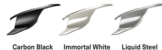
Carbon Black Immortal White Liquid Steel