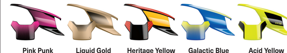
Pink Punk Liquid Gold Heritage Yellow Galactic Blue Acid Yellow