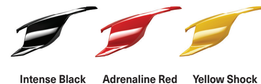
Intense Black Adrenaline Red Yellow Shock