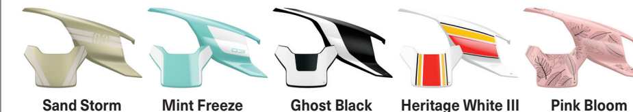
Sand Storm Mint Freeze Ghost Black Heritage White III Pink Bloom